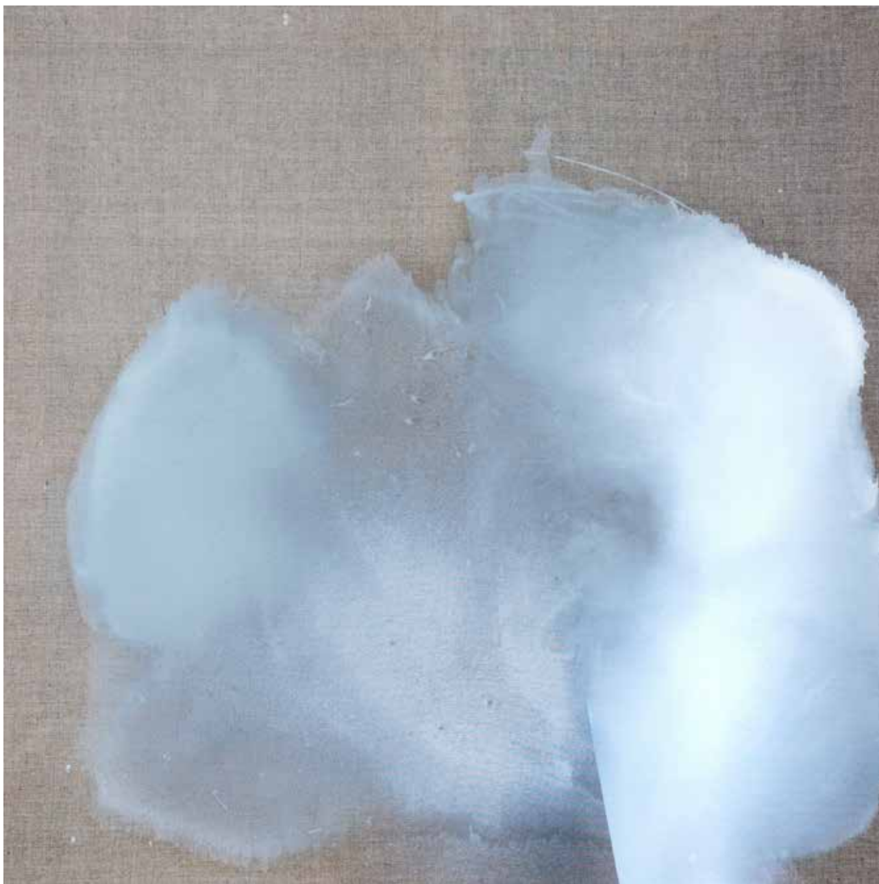
# 05 z cyklu Linia Graniczna olej, akryl na płótnie, 120x120cm, 2016