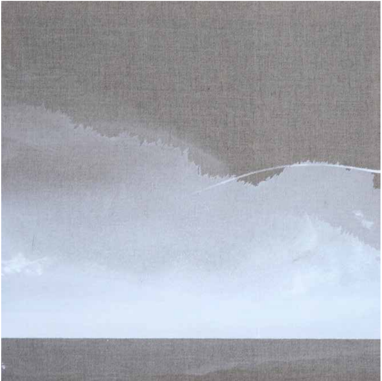
#01 Zapatrzenie z cyklu Linia Graniczna olej akryl na płótnie, 50/50 cm - 6 cm, 2017