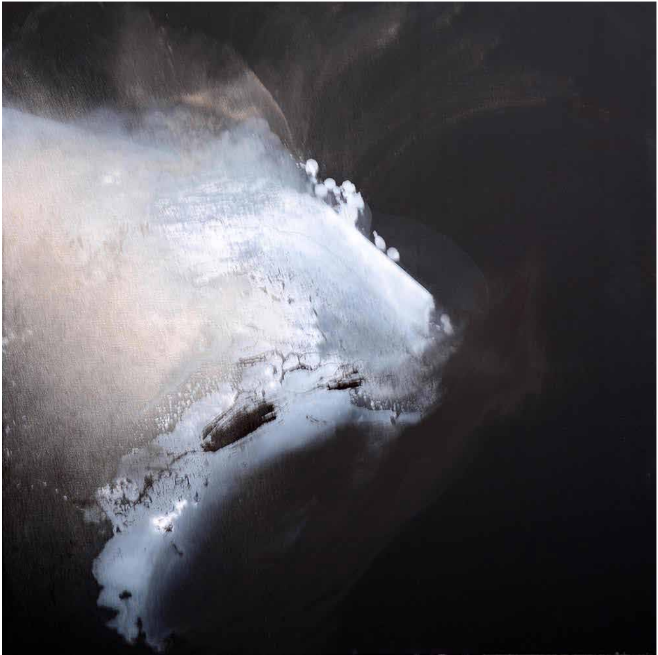
# 03 z cyklu Linia Graniczna olej, akryl na płótnie, 120x120cm, 2016