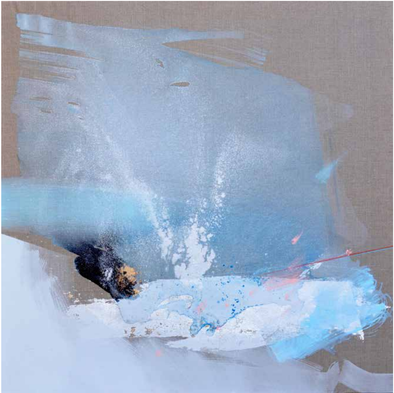
# 21 z cyklu Lapidaria olej, akryl na płótnie, 120 x 120 cm, 2016