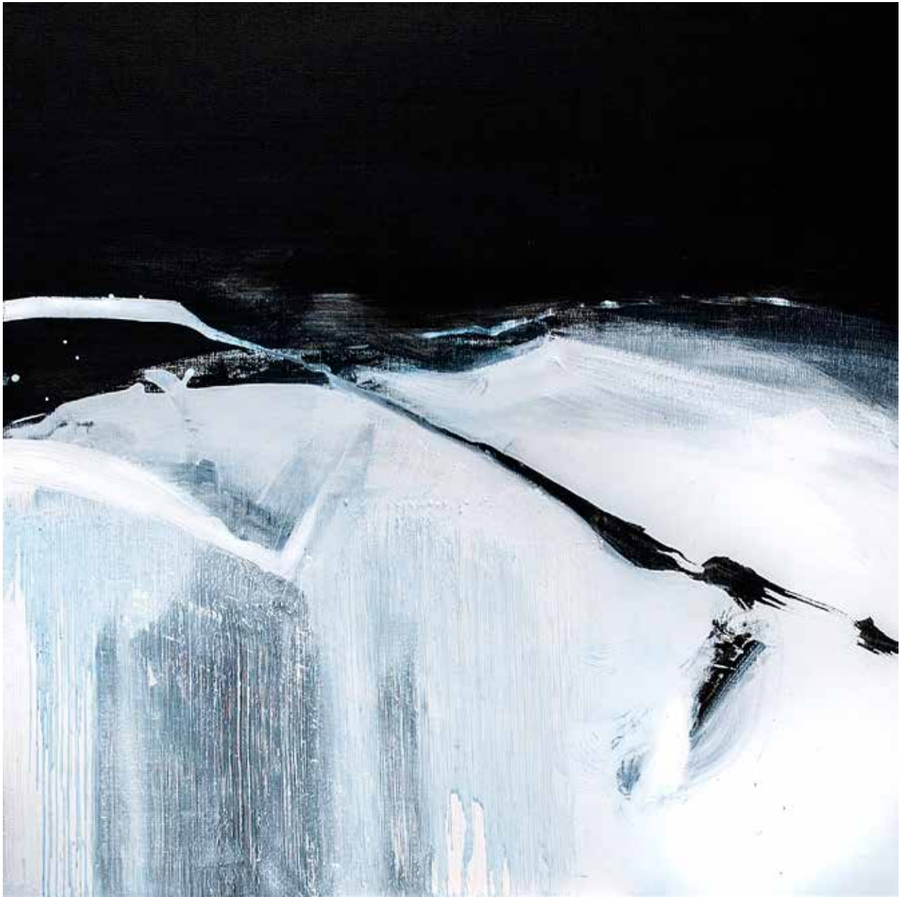
# 03 z cyklu Lapidaria olej, akryl na płótnie, 120x120cm, 2016