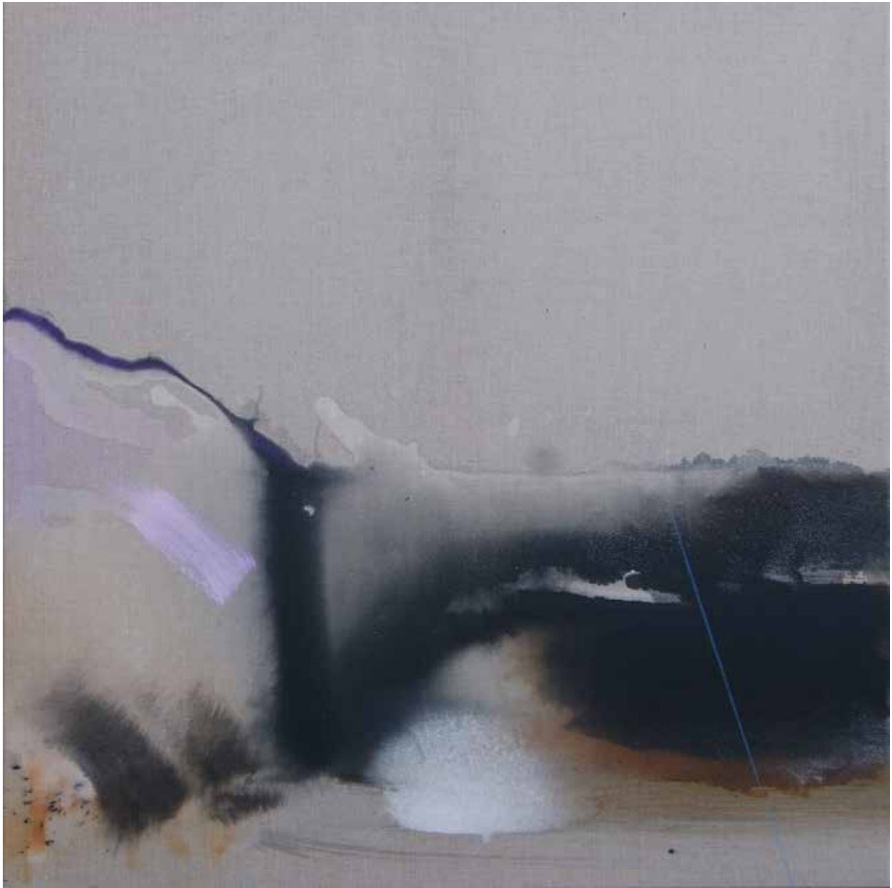
# 17 z cyklu Lapidaria olej, akryl na płótnie, 120x120cm, 2016