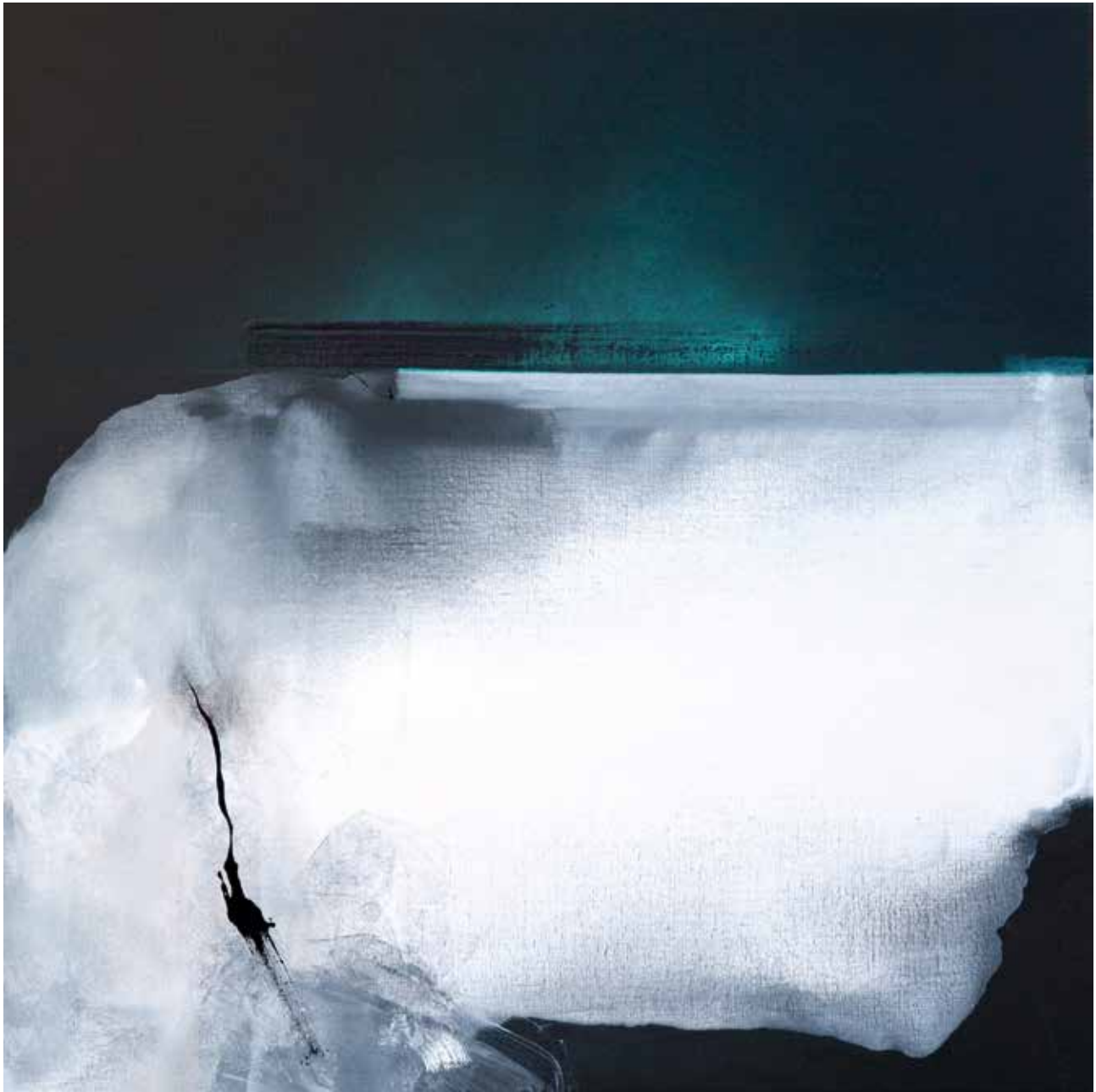
# 01 z cyklu Linia Graniczna olej, akryl na płótnie, 120x120cm, 2016/2017