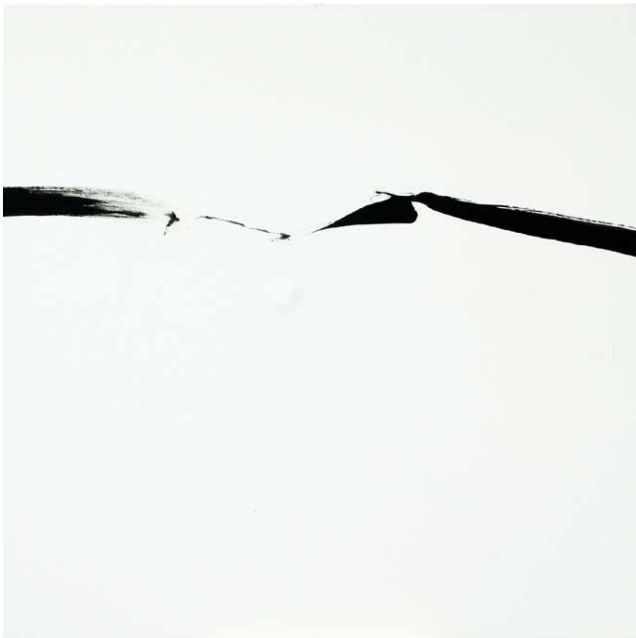
# 08 z cyklu Lapidaria olej, akryl na płótnie, 120x120cm, 2016