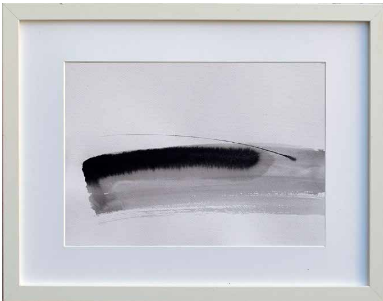
# 17 z cyklu Horyzont, papier, technika mieszna, 30x21 cm, 2016