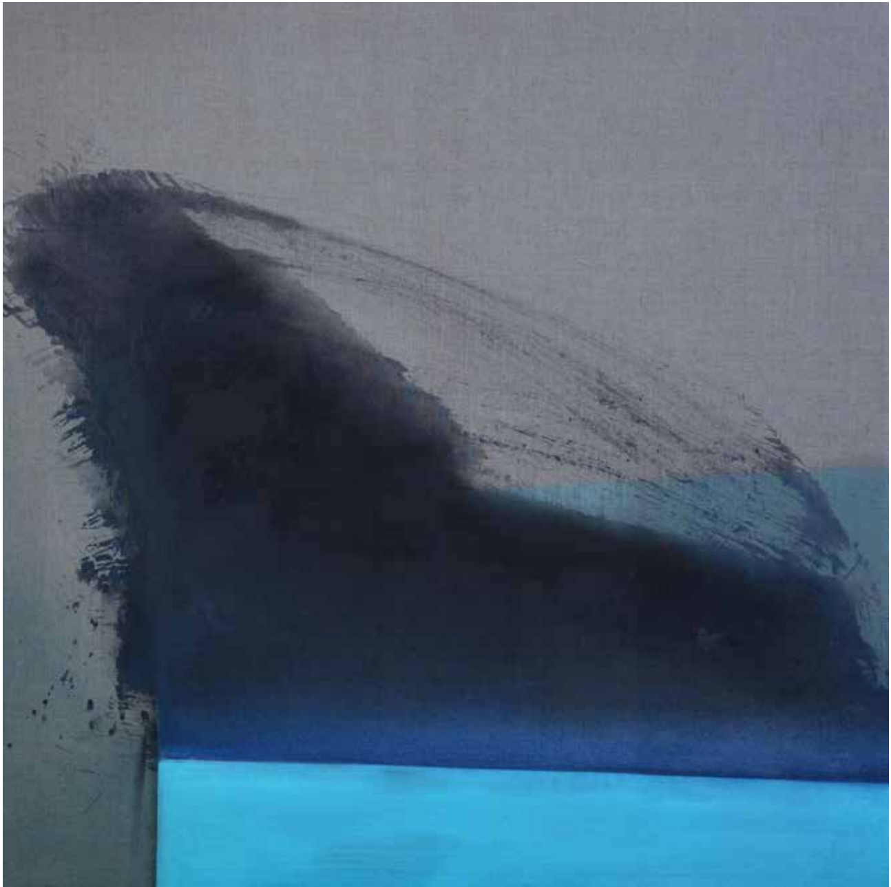
# 02 z cyklu Linia Graniczna olej, akryl na płótnie, 120 x 120 cm, 2016/2017