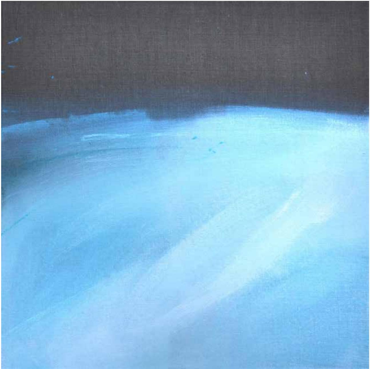
# 05 Zapatrzenie z cyklu Linia Graniczna olej akryl na płótnie, 50/50cm - 6 cm, 2017