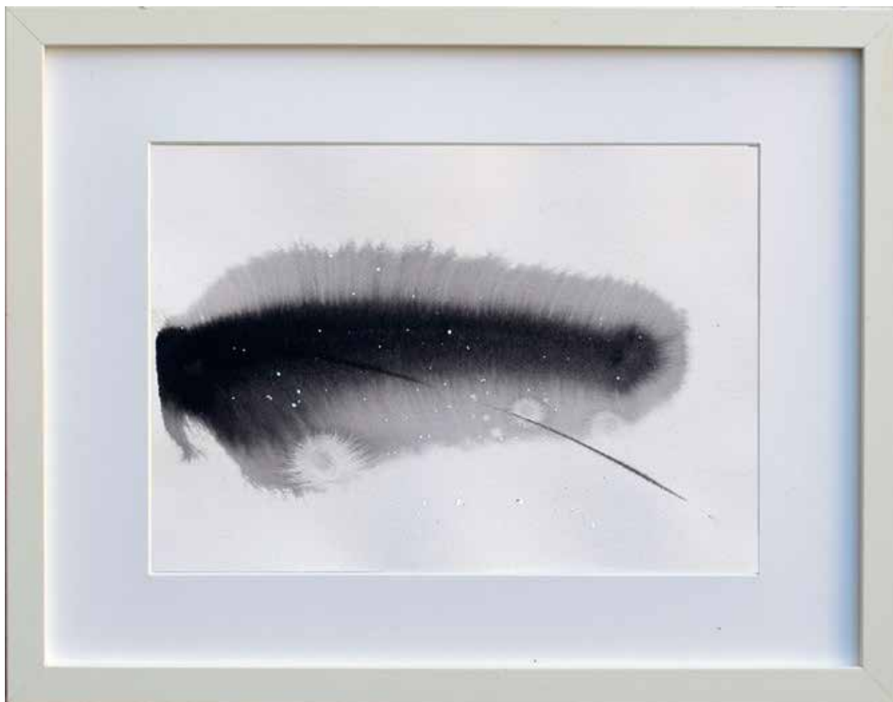
# 16 z cyklu Horyzont, papier, technika mieszna, 30x21 cm, 2016