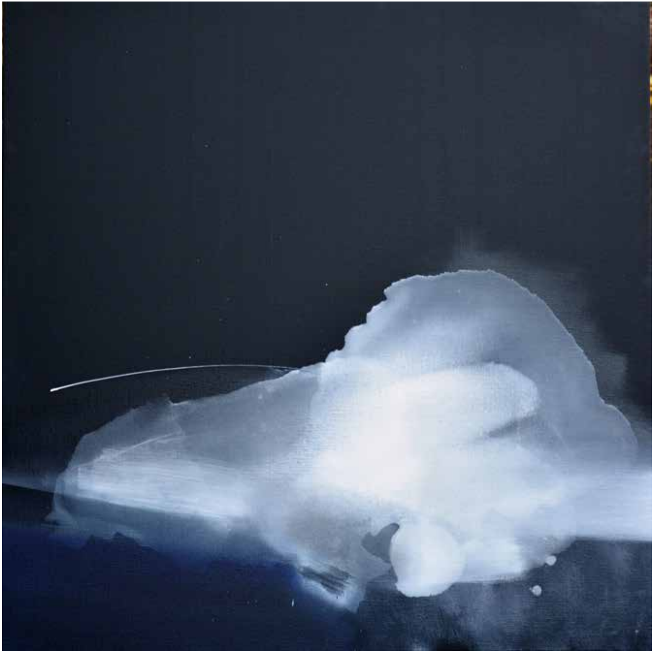
# 04 z cyklu Linia Graniczna olej, akryl na płótnie, 120x120cm, 2016