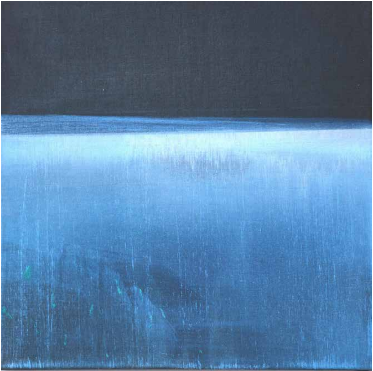
#03 Zapatrzenie z cyklu Linia Graniczna olej akryl na płótnie, 50/50cm - 6 cm, 2017