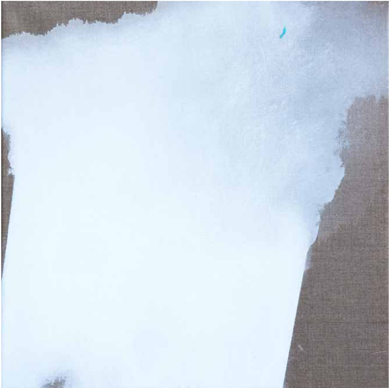
# 04 Zapatrzenie z cyklu Linia Graniczna olej, akryl na płótnie, 50/50 cm - 6 cm, 2017